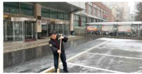
我公司员工正在扫雪